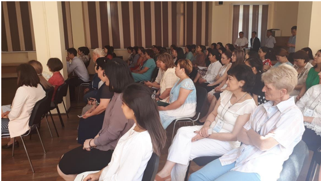
Фото 6. Қызметкерлер мен оқытушылармен кездесу және сұхбат

Аккредиттеу рәсіміне сәйкес 6 оқытушы, 10 дәрігер және 11 тыңдаушыға сауалнама жүргізілді.