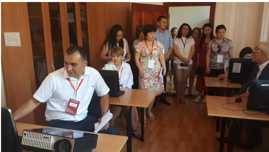
Фото 4. ҰДСО қызметкерлерімен әңгімелесу