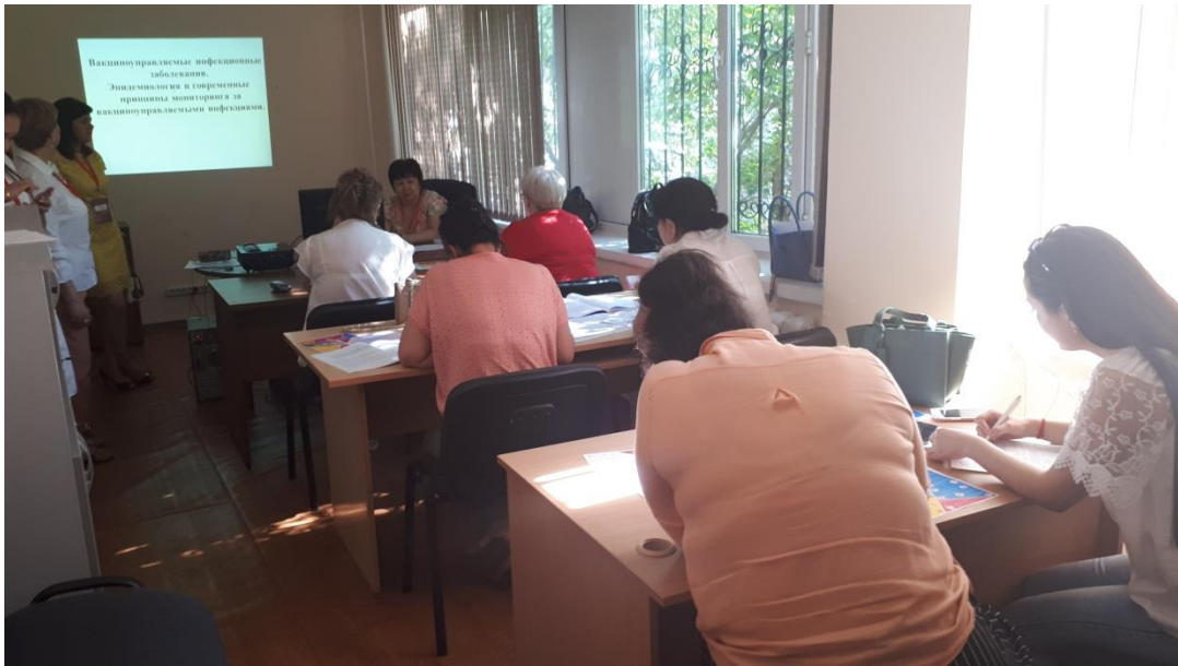
Фото 3. Практикалық сабаққа қатысу

Оқытушылармен кездесу өткізілді. Кездесу барысында сыртқы сарапшылар миссияны қалыптастыруға, оқытушыларды дамыту бағдарламаларына қатысу және ақпараттандыру, оқытушылар оқу процесінде қандай әдістемелік материалдарды пайдаланады, топтарды қалай қалыптастырады, тақырыптық жоспарларға қандай өзгерістер енгізеді деген сұрақтар қойды.